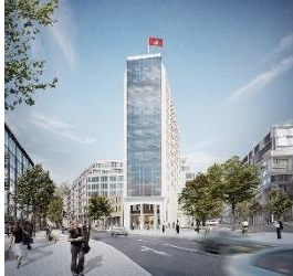
Springer Quartier Hamburg