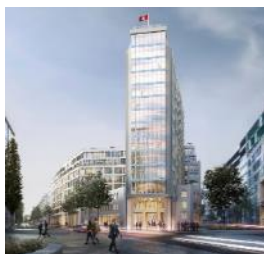
Springer Quartier Hamburg